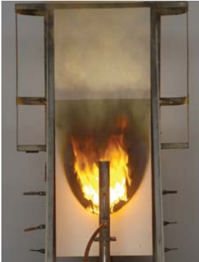
PIR zonder goedkeuring verzekeringsbranche